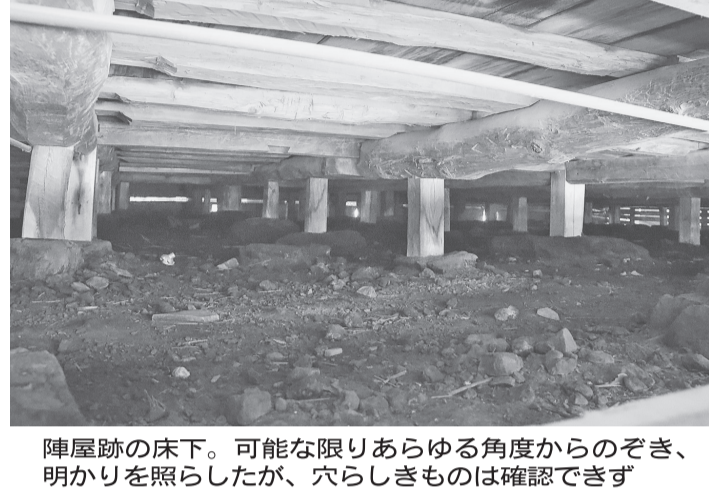
陣屋跡の床下。可能な限りあらゆる角度からのぞき、明かりを照らしたが、穴らしきものは確認できず

穴の形も丸や四角とまちまちだった。複数の証言を総合すると、穴の場所は陣屋入り口の正面階段を上った所に、ある「式台」と呼ばれる板の間下辺りという人が多かった。「やや左寄り」と具体的な位置を記憶している人もいた。穴の形も丸や四角とまちまちだった。複数の証言を総合すると、穴の場所は陣屋入り口の正面階段を上った所に、ある「式台」と呼ばれる板の間下辺りという人が多かった。「やや左寄り」と具体的な位置を記憶している人もいた。