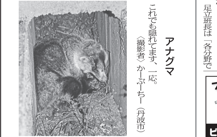
やっとならまえた。このほかに登って見えた。アマガモ

「入門」「基礎」講座が6月開講 丹波市社会福祉協議会が、手話奉仕員養成講座「入門」「基礎」講座をそれぞれ6月から開講する。いずれも16歳以上が対象。定員20人。入門講座は金曜日、基礎講座は木曜日(午後7時～9時)の2回。柏原福祉センター(柏原町柏原)で開講する。入門講座は初めて手話を学ぶ人が対象で、日常生活で必要とされる手話の単語や表現方法を身に付ける。6月30日開講。同日16日締め切り。基礎講座は、1695年(元禄8)、大和国松山藩(奈良県宇陀市)から柏原に国替えになった織田信休が、1714年(正徳4)に建てた柏原藩の藩庁兼屋敷。現存しているのは一部で、往時は東西130m、南北160mほどあったという。1818年(文政1)の火災で多くが焼失し、今ある表御殿は1820年(同3)年に再建されたもので、焼失を免れた長屋門(表御門)と共に、かつての姿を伝えている。今は見られない穴、肝心の抜け道だが、現在も残っている穴の位置は、穴の入り口は、玄関付近の床下にあった。