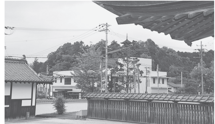
柏原藩陣屋跡から眺めた柏原八幡宮。距離はかなりの距離がある。柏原町柏原で