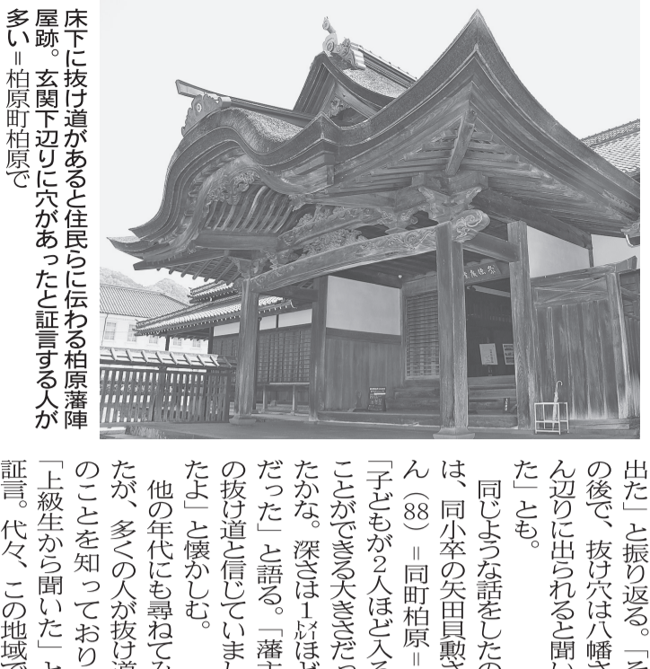
床下に抜け道があると住民らに伝わる柏原藩陣屋跡。穴開きは「抜け道」伝説の証言する人が多く、柏原町柏原で

「陣屋の床下に穴が開いていて、有事の際は八幡さんまで逃げられる抜け道になっていた」といふ話や「以前、柏原地域の住民から聞いた話だ。言わずもがな、陣屋とは柏原藩陣屋跡(柏原町柏原、八幡さん)とは柏原八幡宮(同)のこと。数人に水を向けてみると、この「秘密穴」は柏原地域、特にお膝元の崇広小学校の幅広代で語り継がれているようで、一定の世代から上の人は「何なら穴に入れたことがある」といふ人も多い。両者は直線距離にして300mほど離れており、もしあったとするなら、抜け道より地下トンネルと言った方がしっくりくる。この春、異動により柏原地域の担当になったとを機に、気になっていたうわさの検証を試みる。(田畑知也)